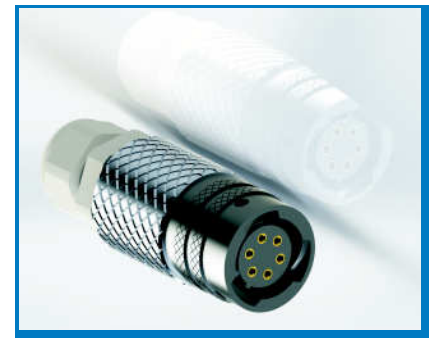
ZUBEHÖR STECKER 6-POLIG